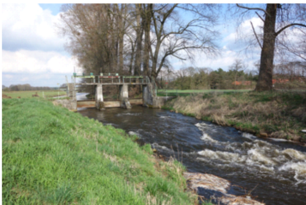
Regelquerschnitt - Umgehungsgerinne M 1:100

im Auftrag des Wasser- und Bodenverbands Boize-Sude-Schaale